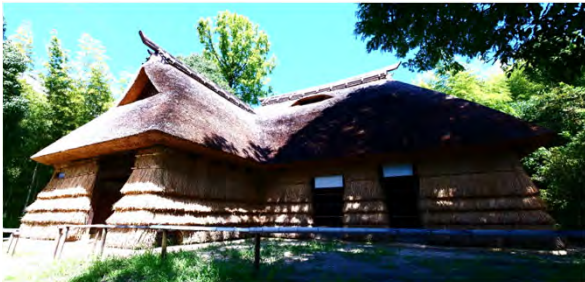
信濃秋山の民家 壁も茅葺きで、独特な雰囲気があります。