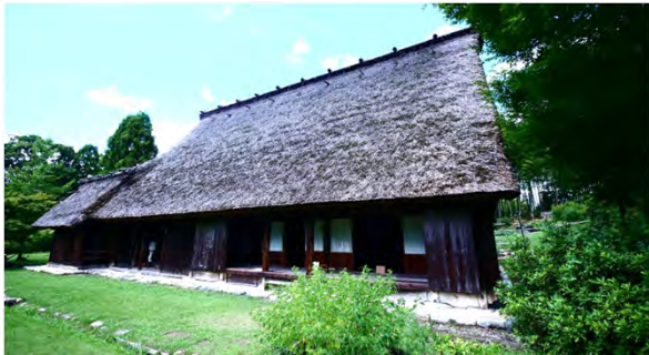
飛騨白川の合掌造り民家 20人で住んでいたとか！？